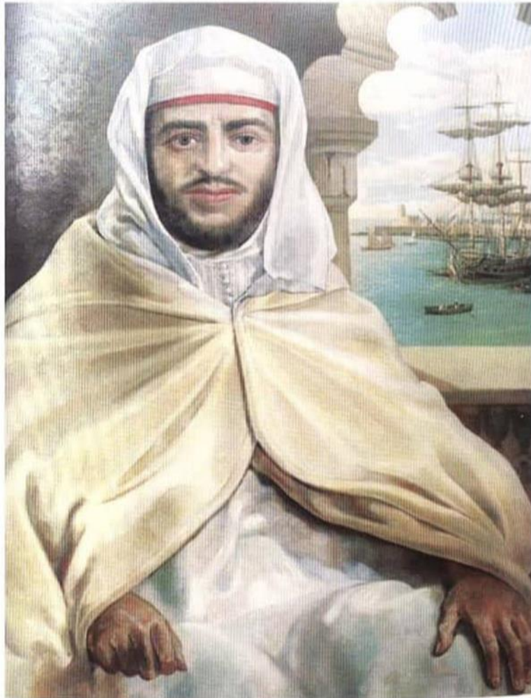
صورة السلطان سيدي محمد بن عبد الله بن إسماعيل العلوي