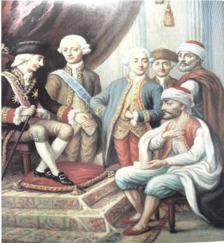
كارلوس الثالث ملك إسبانيا يستقبل السيد محمد بن عثمان مبعوث السلطان سيدي محمد بن عبد الله العلوي. (متحف محمد الخامس بالرباط)