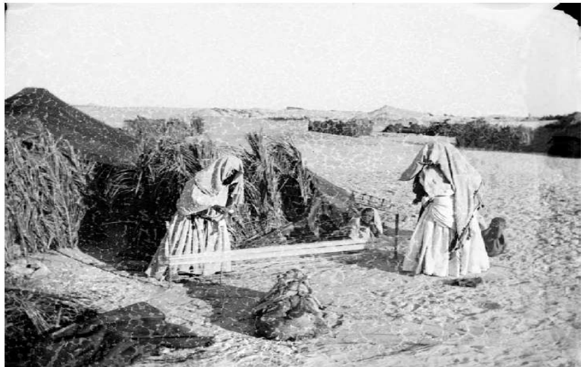
18/ Référence : D87-029 Algérie, El-Oued, novembre 1901. La préparation du fil pour le tissage.

Photo 18 Deux femmes d'une tribu nomade préparent le fil pour le tissage des étoffes à l'aide d'un métier fixé sur le sable devant leur tente, aux environs d'El-Oued en novembre 1901. Sur le côté, les enfants semblent intrigués par le photographe.