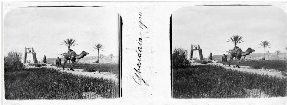
16/ Référence : D87-136 Algérie, Ghardaïa, 1900. La corvée d'eau du dromadaire.

Photo 15 Une famille de nomades vient s'approvisionner en eau au puits d'une oasis à Oued Litten en octobre 1901.