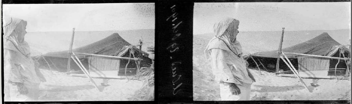
17/ Référence : D87-028 Algérie, El-Oued, 29 octobre 1901. Un métier à tisser dans le désert.

Photo 17 Un métier à tisser devant la tente d'un campement nomade dans le désert aux environs d'El-Oued en octobre 1901.