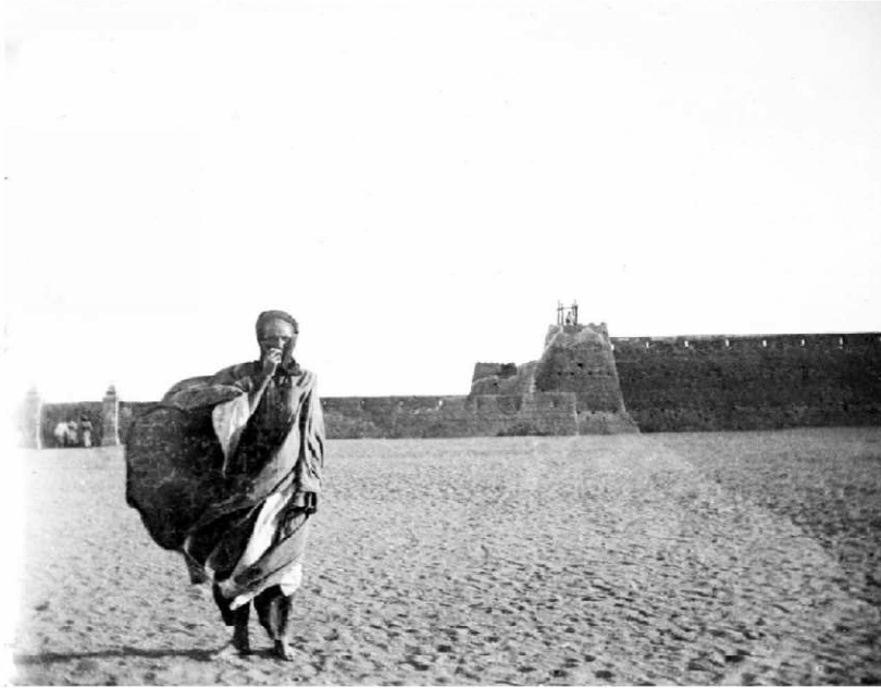
11/ Référence : D87-160 Algérie, Aoulef, août 1902 Un habitant du Mzab.

Photo 11 | Portrait d'un habitant du Mzab devant la casbah d'Aoulef, caractéristique des architectures sahariennes de terre crue en août 1902.