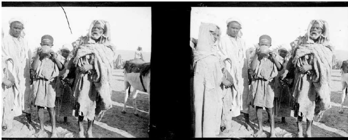
10/ Référence : D87-022 Algérie, Sahara, 1900-1903. Les enfants et le porteur d'eau.

Photo 10 Un groupe d'habitants du Mزاب constitué d'enfants et d'un vieillard porteur d'eau. Grâce au précieux liquide contenu dans une outre fabriquée en peau animale, un enfant se désaltère.