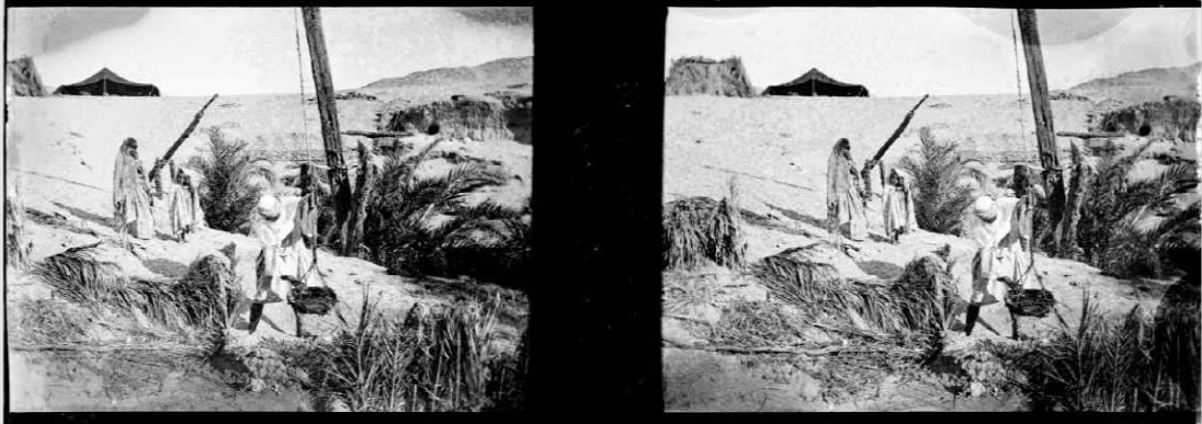
15/ Référence : D87-056 Algérie, Oued Litten, octobre 1901. Les nomades viennent chercher l'eau au puits.

Photo 15 Une famille de nomades vient s'approvisionner en eau au puits d'une oasis à Oued Litten en octobre 1901.