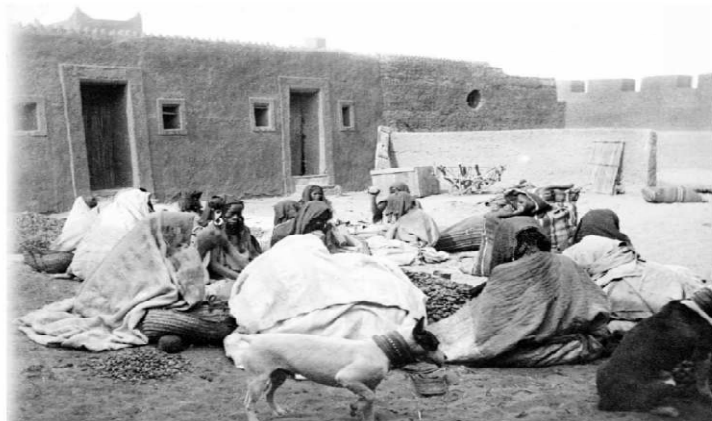
14/ Référence : D87-177 Algérie, In Salah, 8 janvier 1903. Les femmes Hartania pilent les dattes.

Photo 14 Un groupe de femmes Hartania pilent les dattes sur le sol d'une cour commune à plusieurs maisons d'In Salah, le 8 janvier 1903. Peuple originaire d'Afrique centrale, Les Haratin, ou Hartani au singulier, font partie des groupes ethniques sédentarisés des oasis. Les Haratin se vouent presque exclusivement à la culture du palmier-dattier pour le compte d'un propriétaire. Ils forment une classe intermédiaire entre celle des esclaves et celle des hommes libres de classe supérieure. Le Hartani est aussi employé au sein des tribus nomades en qualité de berger.