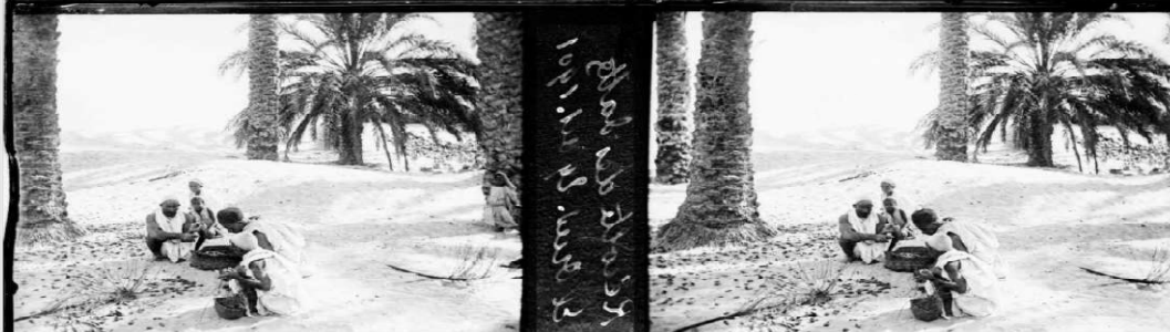
13/ Référence : D87-181 Algérie, El-Oued, 29 octobre 1901. La récolte des dattes.

Photo 13 Un groupe composé d'hommes et d'enfants Souafa ramasse et trie les dattes des régimes tombés sur le sol à El-Oued le 29 octobre 1901.