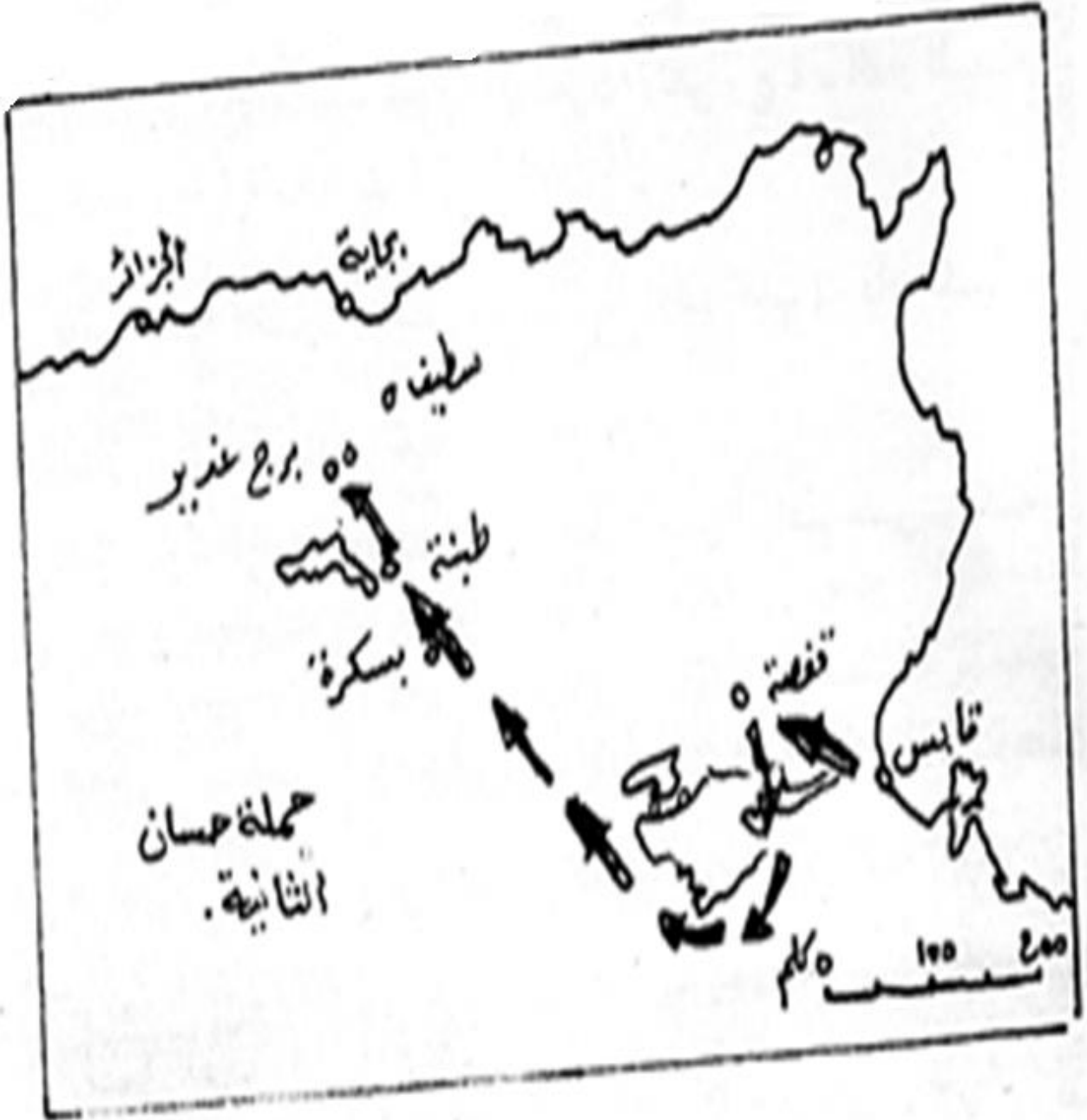
خريطة تبين الطريق التي سلكها حسان في حربه الأخيرة