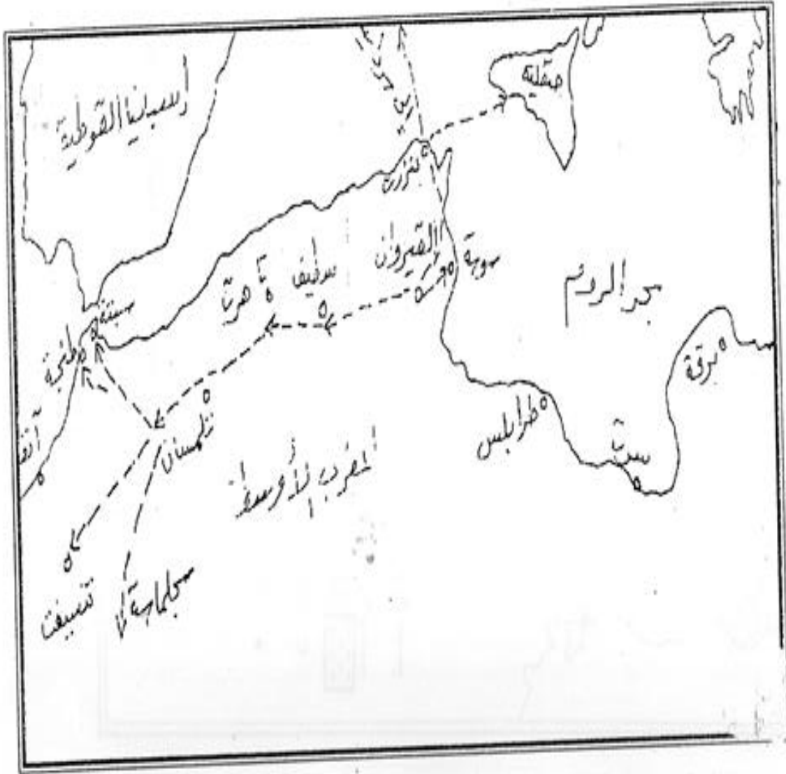
خريطة تبين موقع المغرب الأوسط