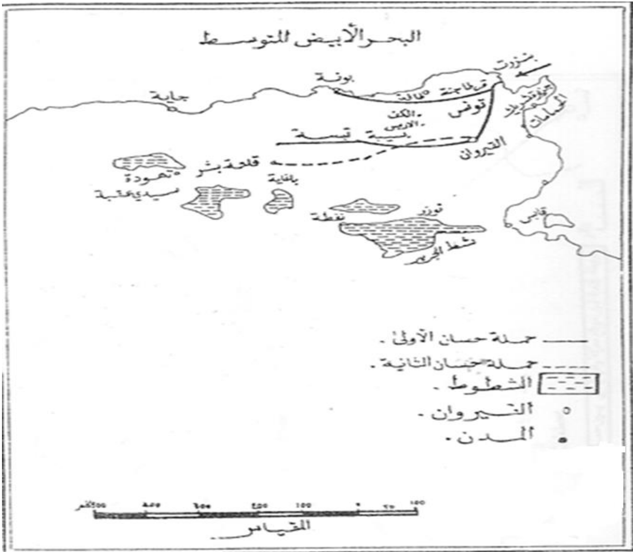
خريطة تبين حملتي حسان الأولى و الثانية على بلاد المغرب