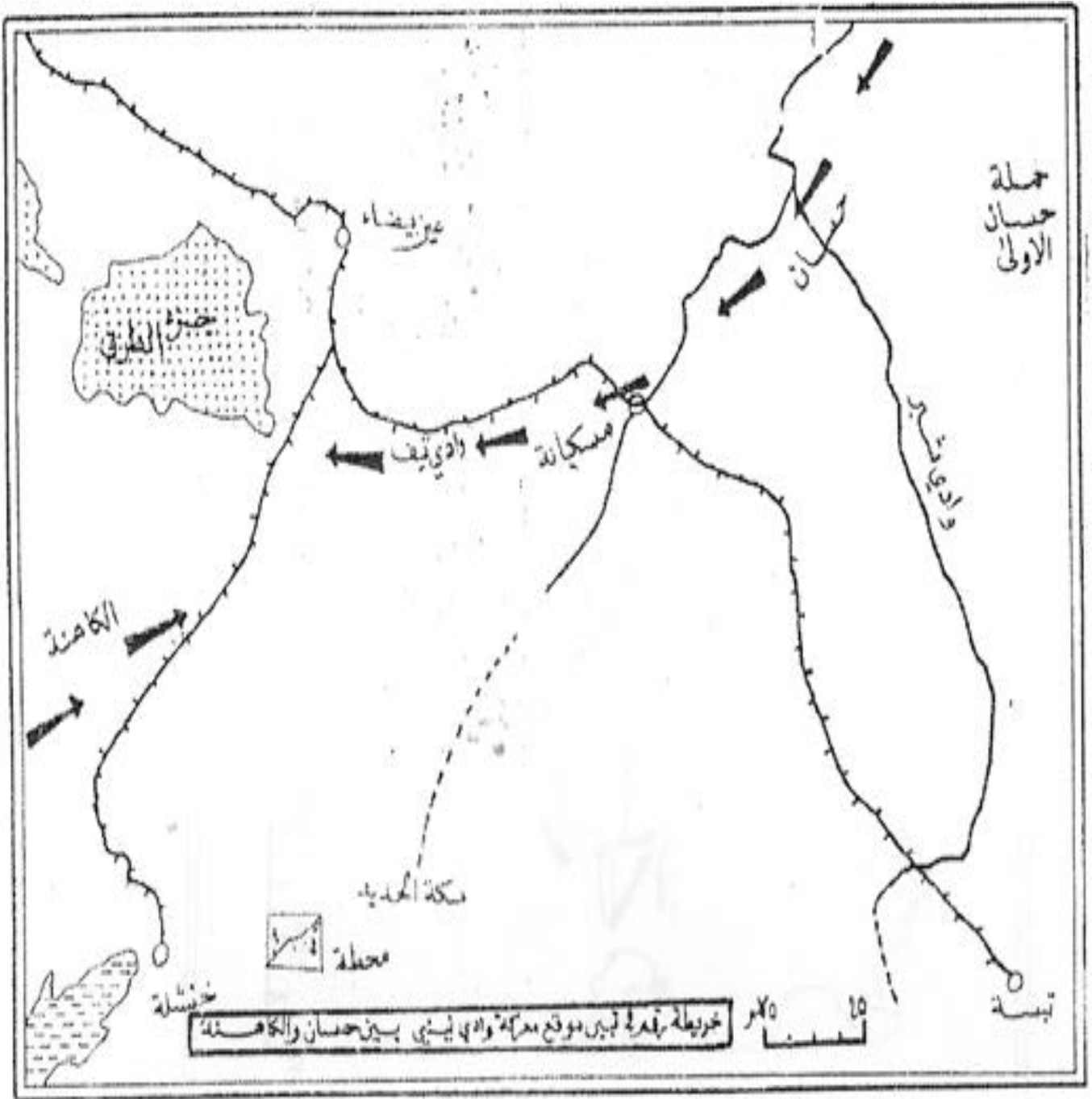
خريطة تبين موقع معركة وادي نيني بين حسان و الكاهنة.