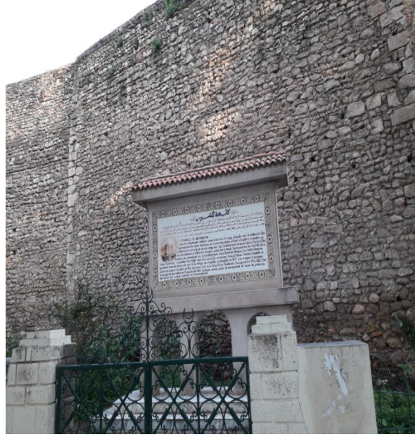
ملحق رقم 08: قلعة المشور بمدينة تلمسان 1 .