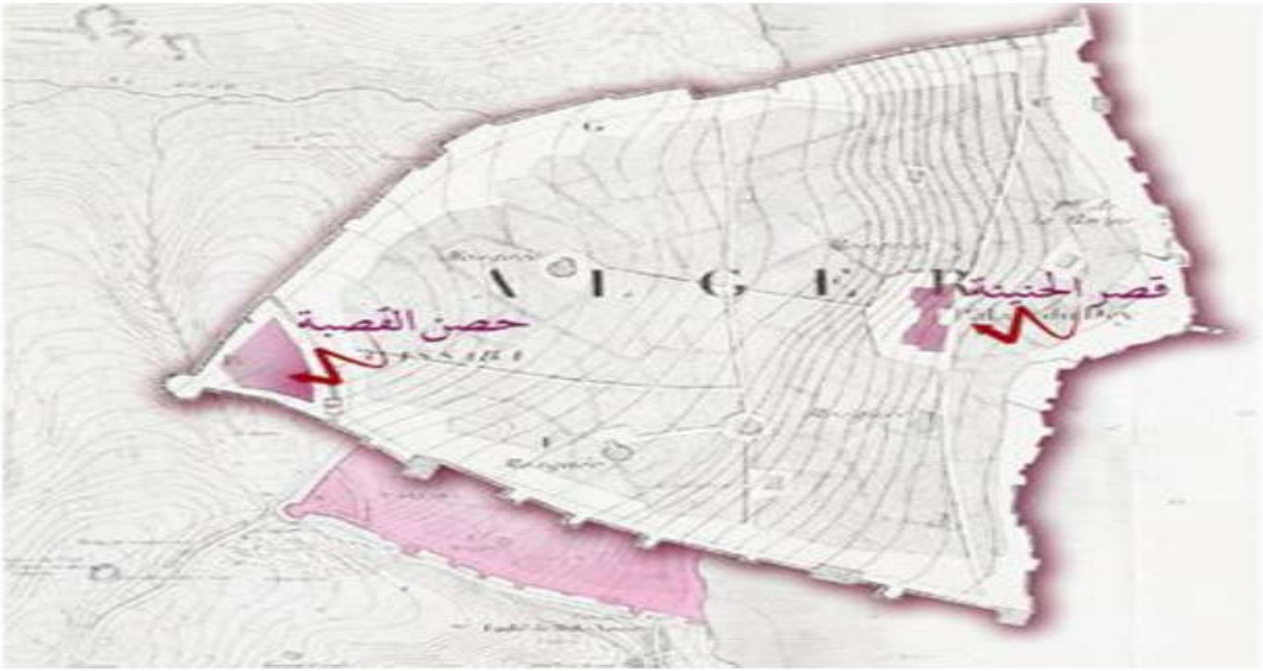
ملحق رقم 12: خريطة توضح موقع حصن القصبة 2 .