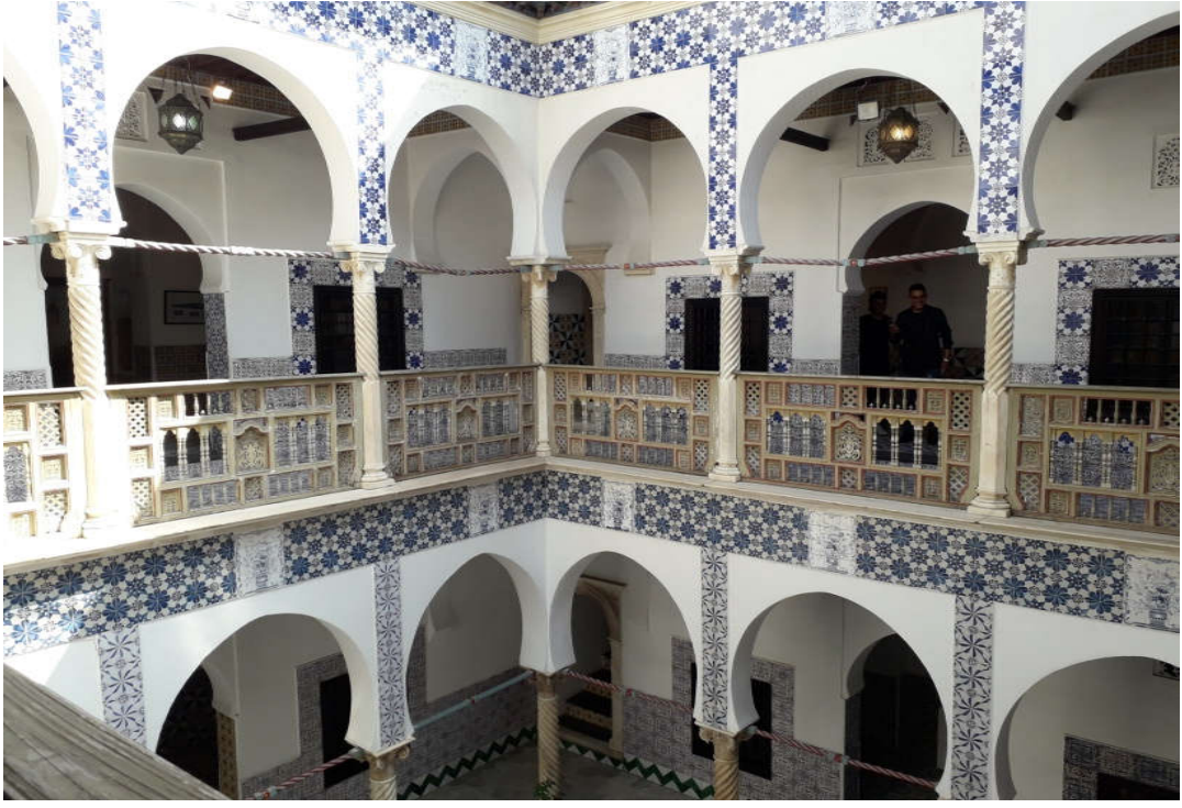
ملحق رقم 11: نموذج لمنزل من قصبة مدينة الجزائر 1 .