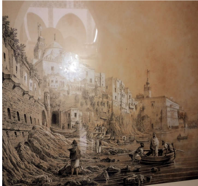
ملحق رقم 09: جزء من أسوار ناحية باب البحر بمدينة الجزائر 2 . ملحق رقم 10: أسوار مدينة الجزائر ناحية باب عزون 3 .