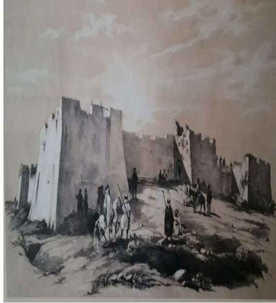
ملحق رقم 06: حصن الإمبرطور بمدينة الجزائر 2 . ملحق رقم 07: برج الكيفان بمدينة الجزائر 3 .