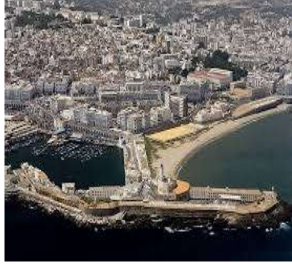
ملحق رقم 05: برج الفنار بميناء مدينة الجزائر (منظر جوي). - منظر أرضي 1 .