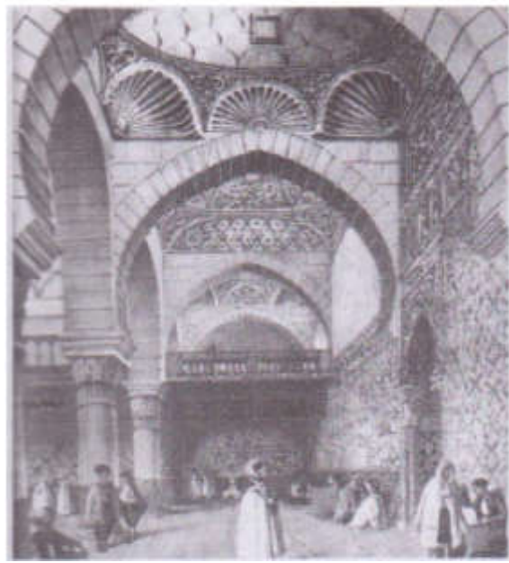
ملحق رقم 01: جزء من بلاط المحراب بجامع كتشاوة 1 . ملحق رقم 02: جامع كتشاوة اليوم 2 .