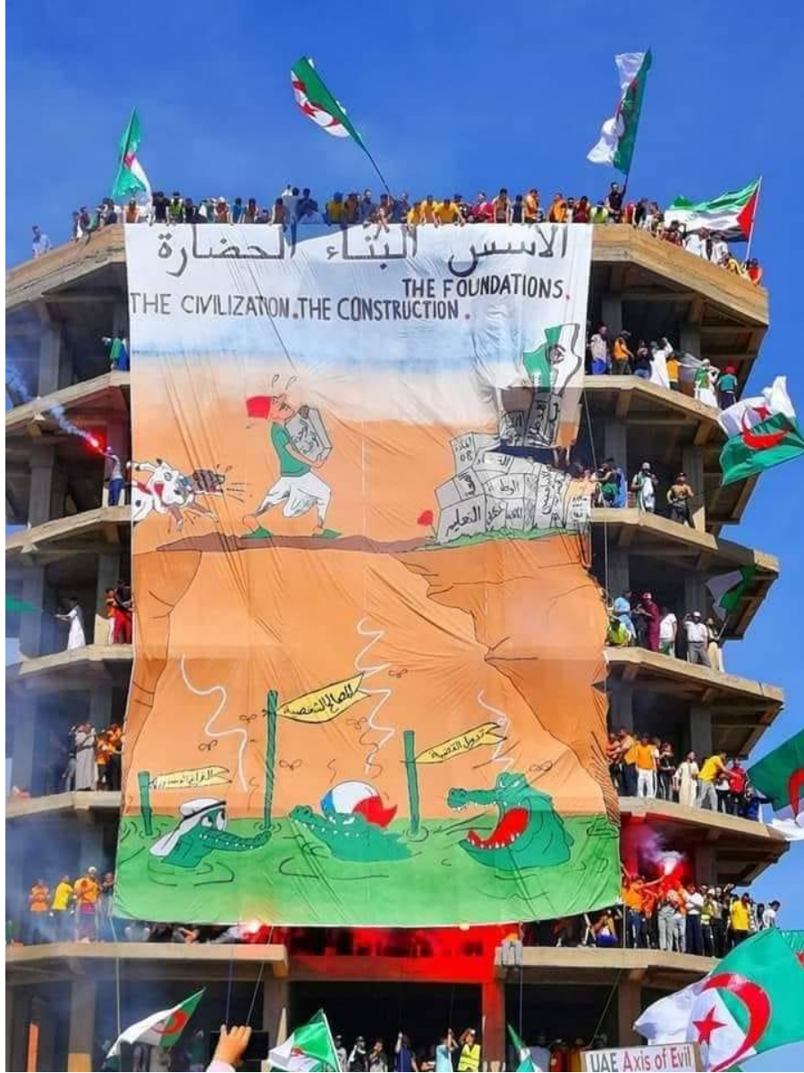
الملحق 4: تيفو برج بوعريريج بتاريخ 04 ماي 2019.