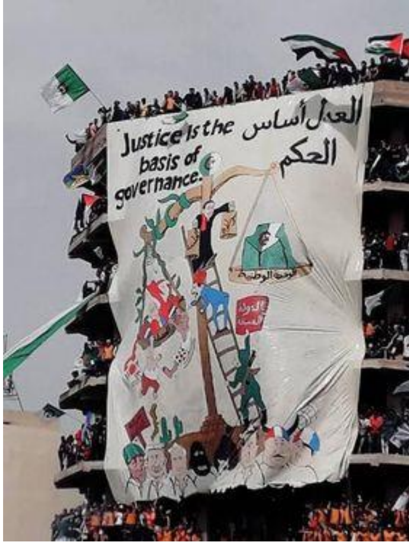
الملحق 5: تيفو برج بوعريريج بتاريخ 19 أفريل 2019.