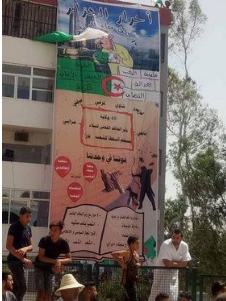
الملحق 3: تيفو برج بوعريريج بتاريخ 14 جوان 2019.