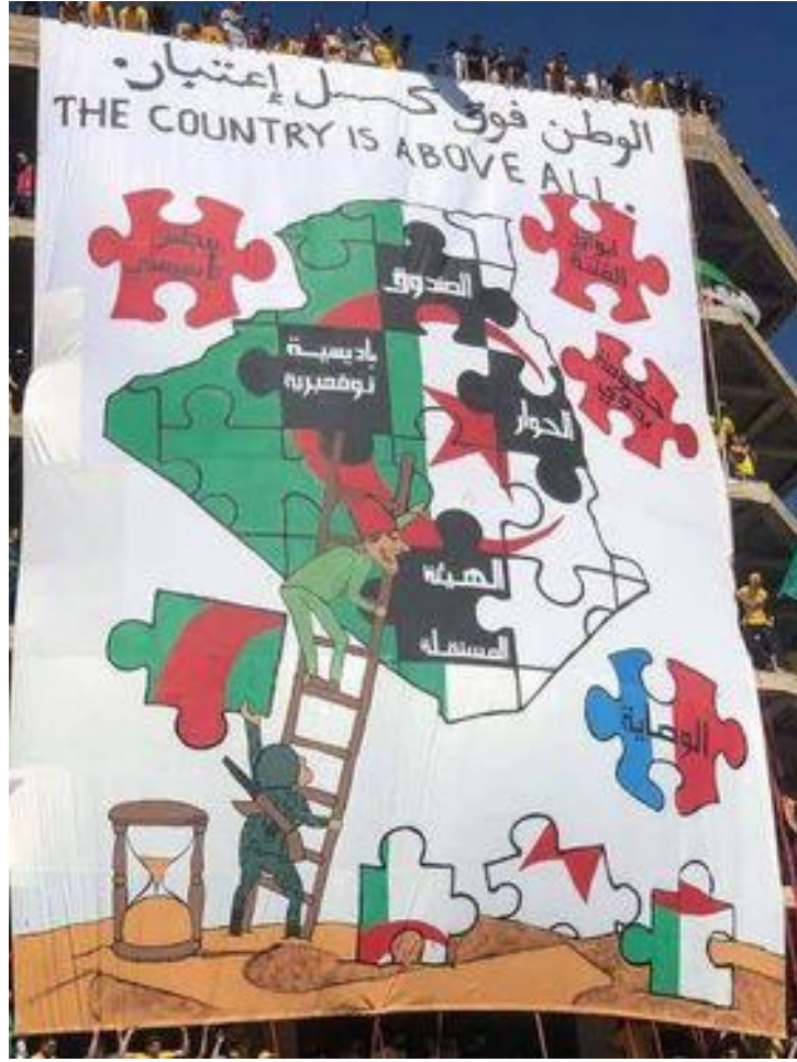
الملحق 2 : تيفو برج بوعريريج بتاريخ 31 ماي 2019.